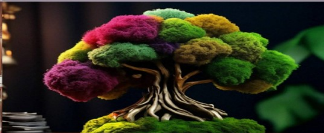
ART GALLERY HWAN